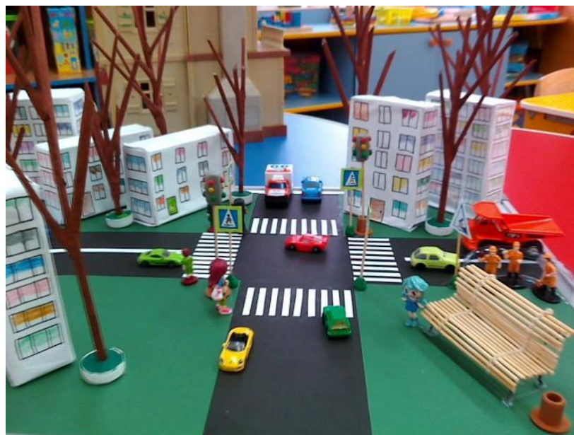
Все знаки расставили, машинки, человечков.